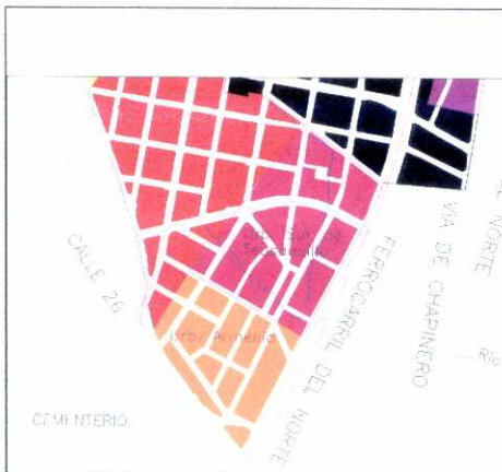
PLANO DE URBANIZACIONES

En el barrio Armenia la arquitectura encierra su espacialidad. Las manzanas de edificios sobre la calle 26 y la avenida Caracas, parecen querer establecer una muralla de protección, mientras que el otro costado, al norte, se abre con viviendas de dos pisos.