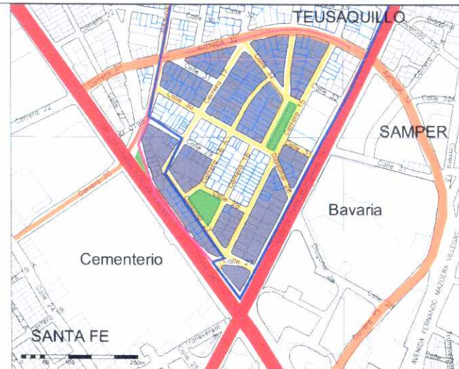
Inmuebles de Interés Cultural - MORFOLOGÍA EN PLANTA